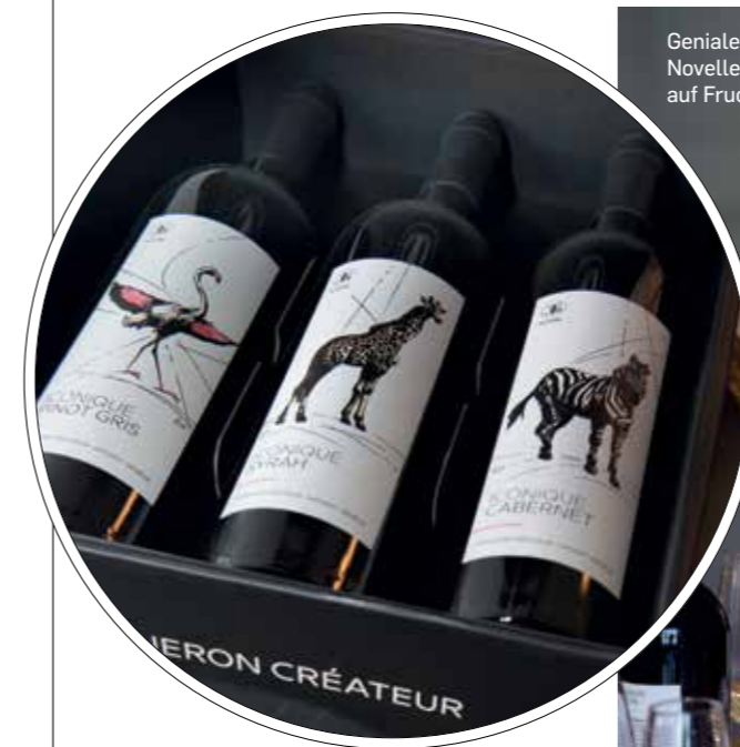
Genialer Einzelgänger: Jean-Michel Novelle setzt kompromisslos auf Frucht und Säure.